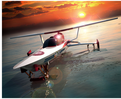
Sealab: veicolo marino ad elevate prestazioni