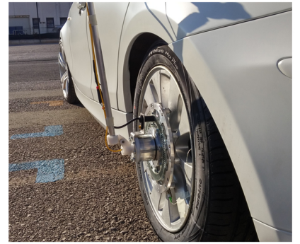
Optyre: sistema di monitoraggio real-time dello pneumatico